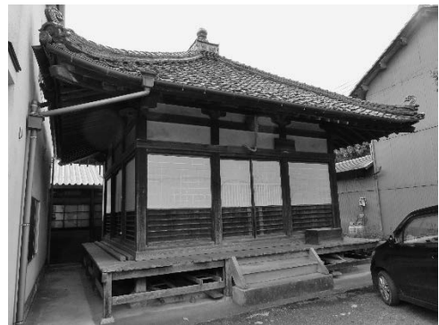
生家跡付近のお堂

次に訪れた芳井歴史民俗資料館では、完造が奉公先から恩師に宛てた手紙などの所蔵資料を出していただき、資料の整理状況などの説明を受けた。さらに車を走らせ、井原市芳井生涯学習センターでは、2000年に製作された胸像（上海の魯迅記念館と同じもの）や郭沫若直筆の内山完造追悼詩を見学し、隣接する井原市立芳井図書館では、中性紙の保存箱に丁寧に保管されている内山完造の著作など彼にまつわる図書群を見せていただいた。最後に、井原駅方面に向かう途中の桜橋公園にある「内山完造先生頌徳碑」（1979年建立）を見学し、井原市での完造ゆかりの地めぐりを終えた。その後、研究会一行は、翌週豪雨被害を受けた井原鉄道井原線を乗り継ぎ、次の目的地となる岡山まで移動した。