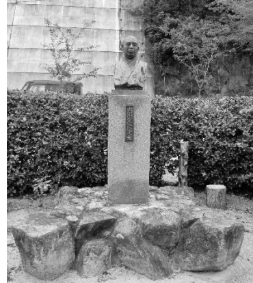
頌徳碑の横にある完造の胸像

井原市内をめぐるなか、没後20年、40年を記念して頌徳碑や胸像がつけられるなど、内山完造が地元出身の重要な人物として位置づけられているのを確認できた。今回訪問した主な場所は以下の地図を参照（本稿における写真・地図はすべて筆者撮影・作成である）。