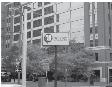
図 13 デトロイト市内にて

図 13 は市内で見た標識である。パーキングの標識と道路標識はいずれも最もよく目立つ色の組み合わせ (黄色地に黒, 橙色地に黒) になっていて, 色彩心理学のテキストのような彩色である。注目すべきは, 左下に見える「一方通行」の標識である。これが黒白である。この黒白の標識は全米で統一されているようで, 著者にはアメリカの印象を強く抱かせるものの1つである。黒白のパーキング標識もある (図 14)。黒白のパーキング標識はわが国ではめったに見ないものである。