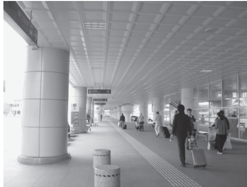
図 24 釜山空港の連絡通路