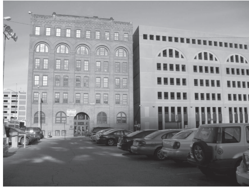
図7 デトロイト市内にて