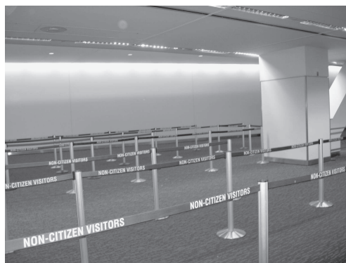
図 22 ロサンゼルス空港の出入国管理

公衆電話も基本的に無彩色と部分的な青色である（図 25）。待合室も無彩色志向であり（図 26）、そうした中で自動運転のトラムの真紅が鮮やかである。移動物体はアクセントカラーであり、かなり鮮やかな色彩が用いられるという原理がここでも見られる。これはロンドンにおける真紅のダブルデッカーと同じ発想である。