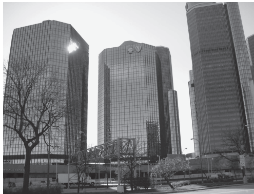
図5 デトロイト市の新しい顔

上の友人の証言を裏付けるのが図4のデトロイト市中心部の景観である。まさにグレーの高層ビルの中に茶色のビルが混じって見られる。しかし最近では図5のようなガラス張りの高層ビルが出現し、新しい顔を形成している。図4の伝統的なスカイスクレイパーと比べ、図5のモダンなビルはあまりにも機能的過ぎ、伝統的な街並みとうまく融合しているとは思えない。図6は市内で見た新旧のビルの景観である。デザイン、色彩、高さのどれをとってもマッチしているとは思われない。