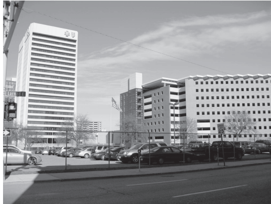
図10 デトロイト市内にて