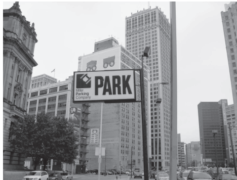
図 14 黒白のパーキング標識