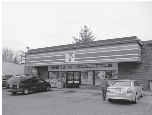
図 27 セブンイレブン（デトロイト市近郊にて）

アメリカのセブンイレブンとて、その色彩はわが国のものと何ら変わらない（図27、28）。色彩的に何か周囲の環境に配慮しているような形跡は見られない。ただし外の看板は高さが短い「短縮看板」であった（図28）。この店ではいつ頃から短縮看板としたのか、あるいは最初からそうなのか、分からないが、住宅街へとつながる道路沿線の店舗であることからの配慮であろう。わが国でもところどころで見られる（三星、2011d）。