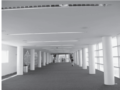
図 23 ロサンゼルス空港の連絡通路