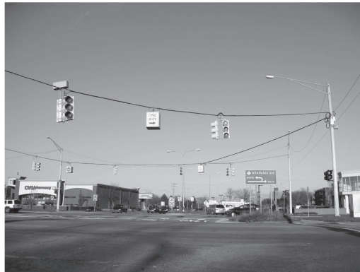
図1 デトロイト市近郊にて

ちなみにわが国は世界の中の蛍光灯王国で、蛍光灯の生産量は年間約3.7億本に達する（管，2005）。一人当たりに計算すると年間約3本の消費となり、アメリカの2本、ヨーロッパの1~2本を大きく上回る。欧米の人は蛍光灯というよりも、白い光が苦手のようなのである。しかし今や電球色型と呼ばれる白熱灯のような赤っぽい光を放つ蛍光灯やLEDも開発されているので、普及することが予想される。