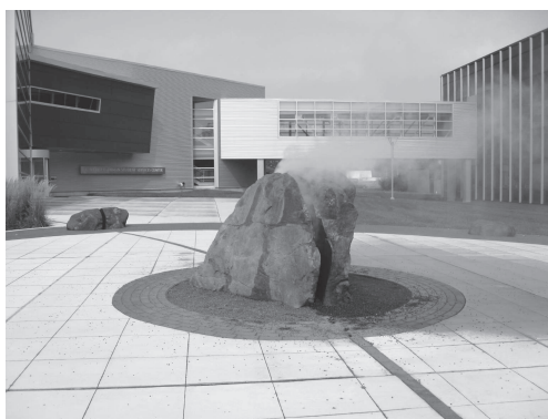
図 12 デトロイト近郊の大学の風景 (2)