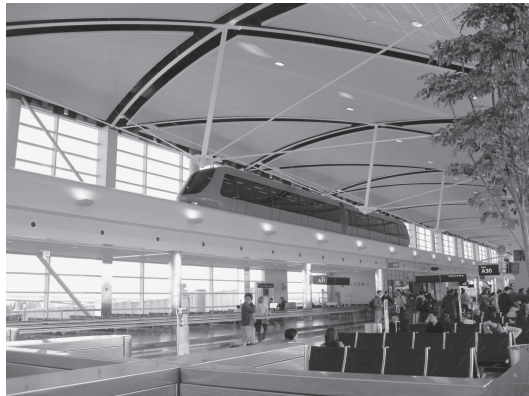
図 26 自動運転のトラム（デトロイト空港） 無彩色の中で赤色の車体が映える。