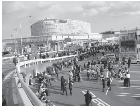
図 31 地震直後の成田空港