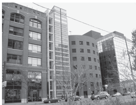
図6 デトロイト市内にて

しかし図7、図8、図9などはうまく調和している例であろう。色彩の観点から見ると、グレーや茶色、クリーム色が多いようである。図10は全体としては必ずしもマッチしているとは思えないが、右側の2つの建物はおそらく駐車場ではないだろうか。高さはずいぶん違うものの、左側の黒白ストライプの高いビルと同じデザインとし、それとの調和を図っている。ただそれをカバーするかのように似たような色彩の「覆い」が施されているのは、その意図がよく分からない。