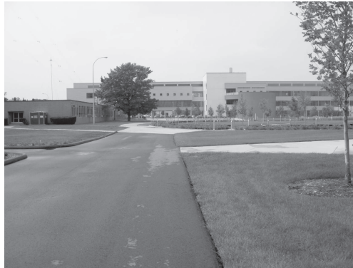
図11 デトロイト近郊の大学の風景（1）

案内してくれた Kaiser 氏が勤める大学を図11と12に示す。例によって広大な敷地で、建物は全体の中のほんの一部にすぎない。全体として白またはグレーで、その中に茶色の建物や部分的に青色の壁が混じって見える。この大学は理工系の大学で、白やグレーを基調として、その雰囲気を醸し出している。青色が自然科学を連想させるのはわが国の大学生の特徴であり、アメリカの大学生にはないと思っていたが（千々岩，2001），現在ではそうとも言い切れないようだ。