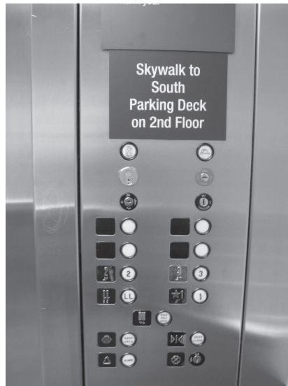
図 21 エレベーター内の表示板（ロイヤルオークシティ市の病院にて）