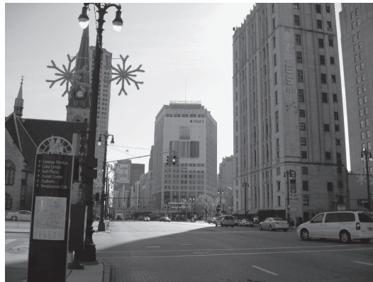
図 16 高い位置にある原色の塗色ロゴマーク