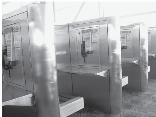
図 25 公衆電話（デトロイト空港）