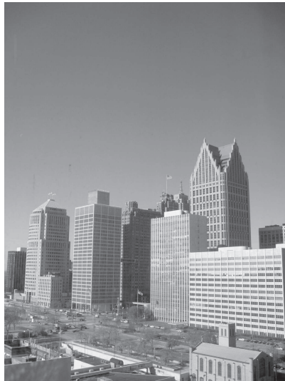
図4 デトロイト市中心部