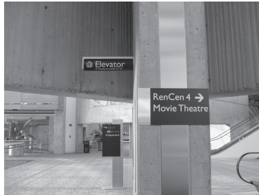
図 19 同