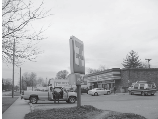
図 28 同

図 29 と 30 はそれぞれ道路沿線と空港内のマクドナルド店である。道路沿線のマック店は思い切り原色の色彩のように見えるが、よく見ると屋根の赤は真赤ではなく、やや紫がかった赤紫色である。この彩色に著者は周囲の環境に配慮されていると感じた。空港内の赤も極力小さな面積に抑えられ、やはり騒色を避けた配色と言えるのではないだろうか。