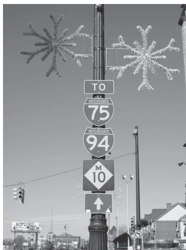
図 17 道路標識

図 15 と 16 はそれぞれレストランの看板と印刷会社の塗色されたロゴマークである。レストランの場合には 1 階にやや原色に近い看板があり、2 階部分に小さな赤色の看板が見える。1 階の色彩の活用は比較的自由にし（オーナーの自由な表現とし）、高い位置の色彩については、街の色彩景観の統一という観点から、制限を加えるというのはしばしば用いられる手法である（那覇市，2003；三星，2011a）。図 15 の 2 階の場合ぐらいは OK なのであろうか。しかし図 16 の色彩はめずらしいケースである。