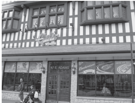
図 15 デトロイト市内にて