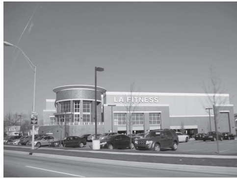
図3 デトロイト市近郊にて