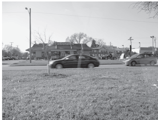
図 29 マクドナルド店（デトロイト近郊にて）

図 29 と 30 はそれぞれ道路沿線と空港内のマクドナルド店である。道路沿線のマック店は思い切り原色の色彩のように見えるが、よく見ると屋根の赤は真赤ではなく、やや紫がかった赤紫色である。この彩色に著者は周囲の環境に配慮されていると感じた。空港内の赤も極力小さな面積に抑えられ、やはり騒色を避けた配色と言えるのではないだろうか。