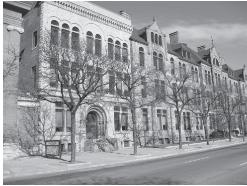
図8 デトロイト市内にて