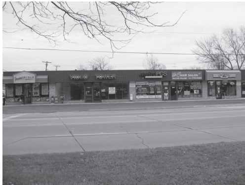
図2 デトロイト市近郊にて