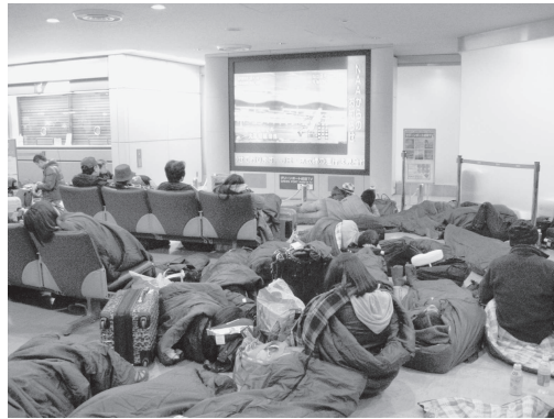
図 32 成田空港で 1 泊