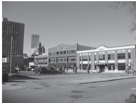
図9 デトロイト市内にて