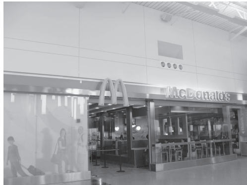
図 30 マクドナルド店（デトロイト空港内）