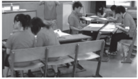
▲：TEG II 練習風景

方でも錯視の体験なども行って楽しんでもらっていたようなので、学生さんからの心理コースの印象はよかったのではないかと手ごたえを感じました。