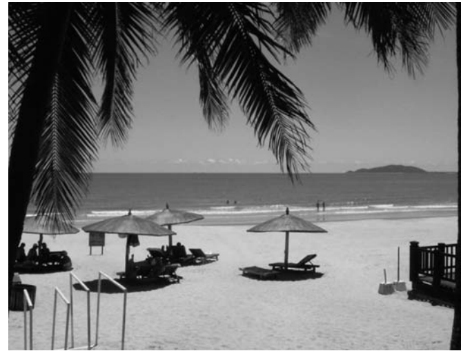
コバルトブルーの三亜ビーチ

旅は最高!! みなさんもぜひいろいろなところへ行ってみてください!!海外でもいいですし、日本でもいいと思います。実際、今回の旅で私は、日本の良さをあらためて感じたので、次は北海道への旅を計画中です。絶対一生の思い出になりますよ!!好きなように計画を立てて、好きなだけ旅を楽しめるのは、学生のうちなのでから!!