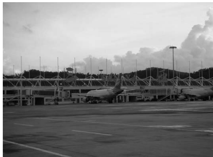
さようなら!!三亜空港

でぜひ食べてみてください!! おいしいですから。そして夜、最後に波打ち際に行き、満点の星を見上げながらゆっくり波の音を聞きました。やっぱり最後は寂しいですね。日本で見ると同じオリオン座が見えました。空はずーっと続いているんだなあ・・・日本に帰っても頑張ろう!! 今回もいい旅になりました。「きつとまた来るからね」と海にさよならをして、眠りにつきました。 最終日 また来るからね 朝は4時に起床。眠い目をこすりながら、7時、三亜鳳凰国際空港発、中国南方航空6731便に乗り、空港の両端にある大きなパイナッブルのモニュメントにさよならを告げ、広州へと向かいました。8時20分に広州に着き、次に乗るのは9時55分発、中国南方航空385便です。が・・・そこでトラブルが発生しました。どこにゲートがあるのかわかんない（笑）始めはゲートを間違えて、あわてて探し回りようやくみつきました。ギリギリ間に合った。飛行機では機内食のうなぎを堪能し、（もちろん今回はC Aさんの写真は撮ったりしません笑）14時55分、成田空港に無事着陸しました。