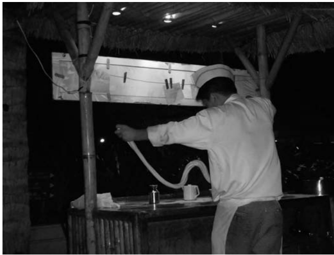
刀削麺をつくっているところ

た。今回の旅は結構泳いだな。食べた分を消化しないよね（笑）でも泳ぐとやっぱりお腹がペコペコになるので（笑）、プールサイドにあるとても素敵なバーへ行って最後の夕食をいただきます。そこでは目の前で刀削麺（とうしゅうめん・・・麺を一度長く伸ばして、字のごとくそれを削ったもちもちしておいしいもの）を作ってくれて、お酒を飲みながらゆっくりいただきます。刀削麺は日本でも食べられるの