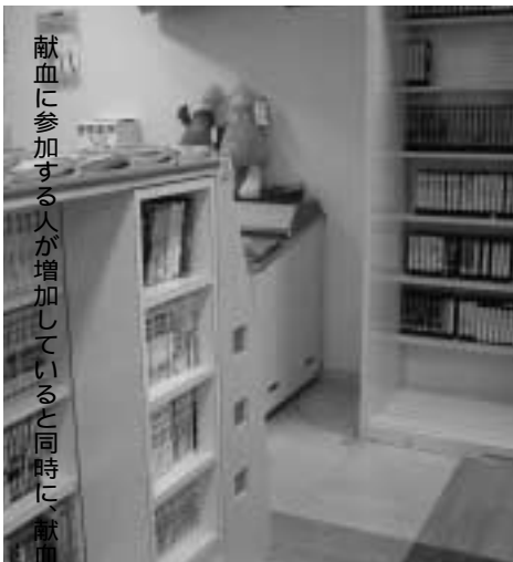
献血に参加する人が増加していると同時に、献血

ここは、全く病院臭くなく、漫画や雑誌、お菓子、ドリンク、そしてDVDと若者には嬉しい設備が充実していますよね。この充実したアフターサー