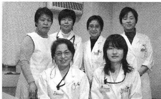
保健室のみなさん