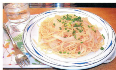
カレーは12種類、スパゲッティーは13種類あるよ。全ての味を制覇してみては？ (2005年1月現在)